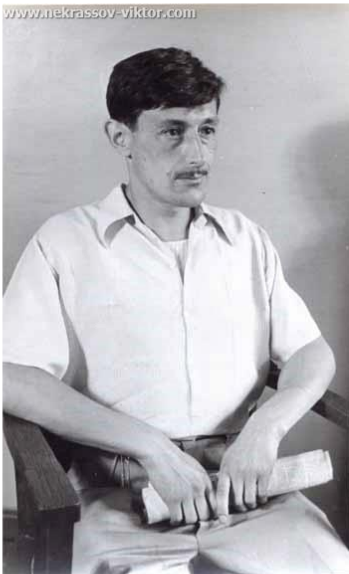
Виктор Платонович Некрасов, 1947 г.